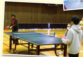
大林体協 親善スポーツ