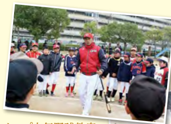
カープ少年野球教室