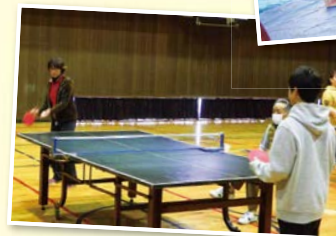
大林体協 親善スポーツ