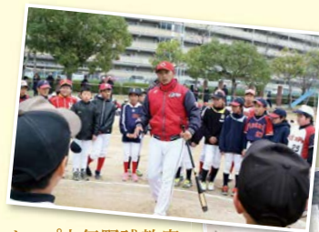
カープ少年野球教室